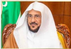
Earth - ٢٠٢٣/١١/٢٣ من ٣٤٠٠ من المشاهدات

وجه معالي وزير الشؤون الإسلامية والدعوة والإرشاد الشيخ الدكتور عبداللطيف بن عبدالعزيز آل الشيخ أصحاب الفضيلة خطباء الجوامع بتخصيص خطبة الجمعة القادمة 10 / 5 / 1445هـ للحد من أهمية بناء الأسرة في الإسلام، ومسؤولية الوالدين تجاه إعداد أبنائهم قبل الزواج لهذه المسؤولية العظيمة... عرض المزيد