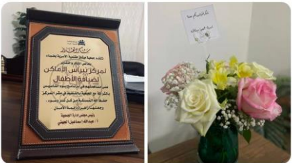
Earth - ٢٠٢٣/٢/٢٦ من ٨٠١٠ ٢٦٦ من المشاهدات

على مساهمتهم في برنامج #يوم التأسيس بالشراكة مع الجمعية بالتنفيذ في مقر الم.