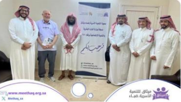
إمارة منطقة تبوك ومؤسسة الملك خالد Earth - ٢٠٢٣/٩/١١ من ٨١٢ ألف من المشاهدات

انطلاقاً من حرص واهتمام صاحب السمو الملكي الأمير #فهد بن سلطان بن عبدالعزيز آل سعود أمير منطقة #تبوك -حفظة الله- بالقطاع #غير الربحي وبالتعاون المشترك بين إمارة المنطقة ومؤسسة الملك خالد تشرفت #جمعية ميثاق زيارة فريق من المؤسسة لمقرها؛ لدراسة واقع المنظمات غير الربحية وتطويرها.